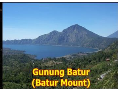
Gunung Batur (Batur Mount)

สัมผัสธรรมชาติ ศิลปะ วัฒนธรรมของชาวบาหลี่ ชมการแสดง บาร์องด้านส์ ชมทัศนียภาพของภูเขาไฟที่ยังคงร่องรอยการระเบิดในอดีต ที่ คินตามานี ชมความงามของ ภูเขาไฟ กุnung บาทูร์ และ ทะเลสาบบาทูร์ ชมวัดอูลูวาตู ที่ขอบมหาสมุทรอินเดีย วิหารทานาล็อต